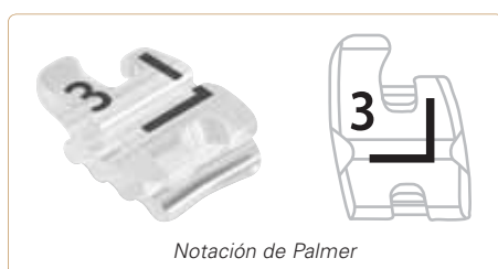
Notación de Palmer

En su manejo GLAM® no se diferencia de otros brackets. Un novedoso marcaje, análogo a la notación de Palmer, impide cualquier confusión a la hora del posicionamiento y posteriormente resulta fácil de eliminar. El ligado se realiza de forma tan probada como familiar.